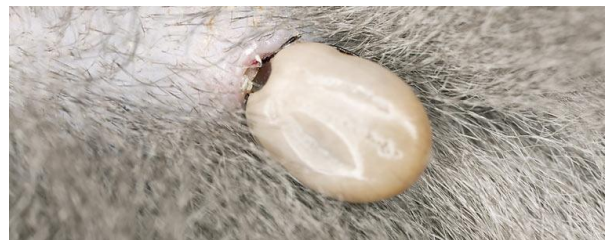
PUUTIAINEN KOIRAN TURKKIIN KIINNITTYNEENÄ.

Kesäpaikka on turvallisin punkkimäärien suhteen, kun aurinko paistaa esteettä lyhyille nurmikoille ja korkea heinä, puskat ja varjostavat puut on raivattu pois. Kissat auttavat jyrtsijätorjunnassa ja säätelevät täten puutiaisen kannankehitystä. Isoista eläimistä varsinkin metsäkauris pitää yllä ja levittää puutiaisia. Ihmisille ei tehoavaa punkkikarkotetta ole tiedossani, peittävä vaatetus ruohikossa toki estää puutiaisen pääsyä iholle.